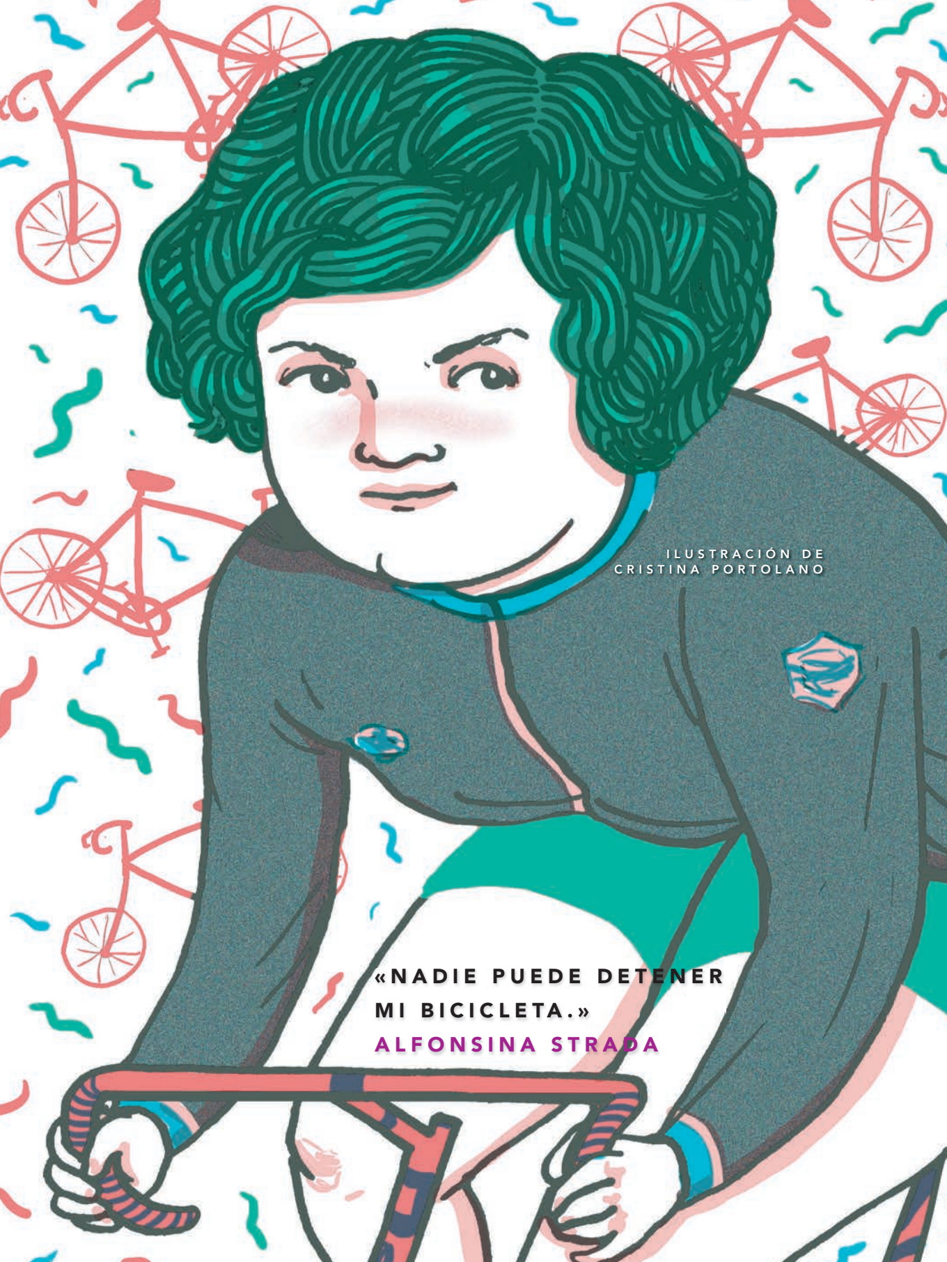
ILUSTRACIÓN DE CRISTINA PORTOLANO

«NADIE PUEDE DETENER MI BICICLETA.» ALFONSINA STRADA